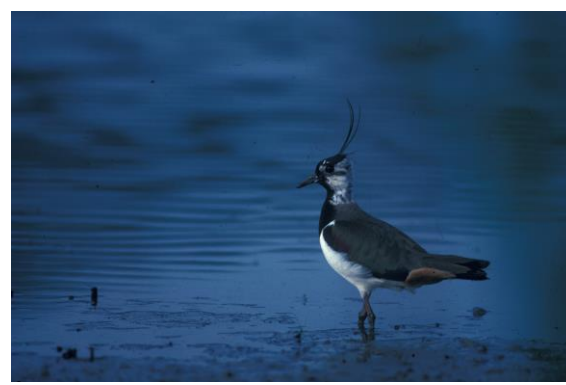
Espèces protégées ou gibier ?